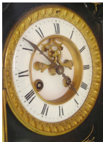
FIGURE 1 – Échappement Brocot

Comme beaucoup d'artisans à l'époque, Achille Brocot n'a pas choisi sa vocation. Fils aîné de Louis-Gabriel Brocot, il collabore puis succède à son père (comme son fils lui succédera). Louis-Gabriel est un artisan ingénieux : remarqué dès 1826 pour une "pendule à sonnerie à râteau et à échappement à repos", il dépose de nombreux brevets entre 1840 et 1853. Le plus célèbre concerne une pièce de transmission entre un mouvement de balancier et un mouvement de rotation, désormais appelée échappement Brocot (les pendules munies de cet échappement sont bien cotées dans les salles de ventes). Baigné dans cette atmosphère de création, Achille va rapidement s'affirmer comme un inventeur as-